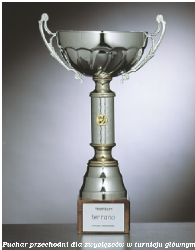
Puchar przechodni dla zwycięzców w turnieju głównym

Memoriał pod patronatem Prezydenta Miasta Poznania